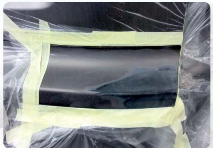
Přesný čas opravy záleží na velikosti poškozené plochy vozidla