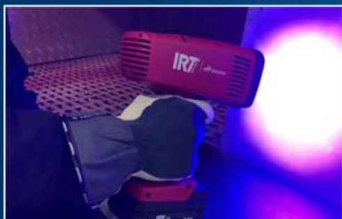
IRT UV SMARTCURE