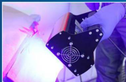
IRT UV SPOTCURE